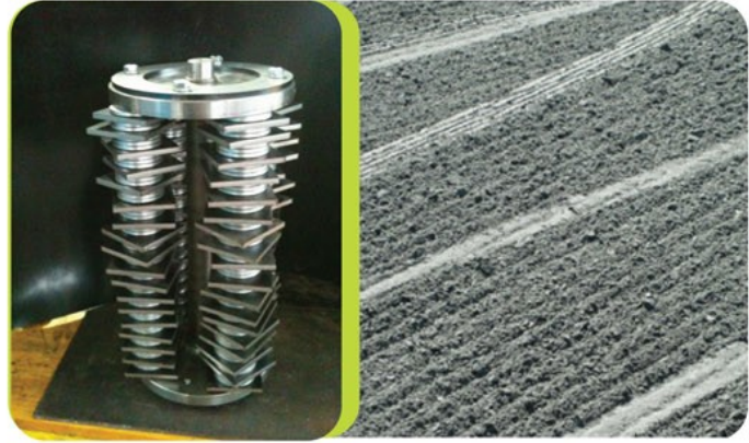
STRONG: effet rateaux