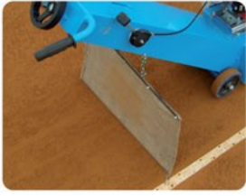
BÂCHE DE PROTECTION

Un levier de sécurité empêche toute erreur ou problème en cas d'urgence: lorsque l'utilisateur lâche la poignée, le moteur s'éteint, les lames s'arrêtent de tourner et le moteur s'éteint automatiquement.