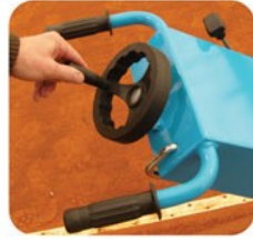
RÉGLAGE DE LA PROFONDEUR