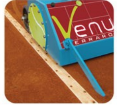
INDICATEUR DE DIRECTION À COURIR LE LONG DES LIGNES