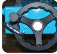
BLOC DE PROFONDEUR